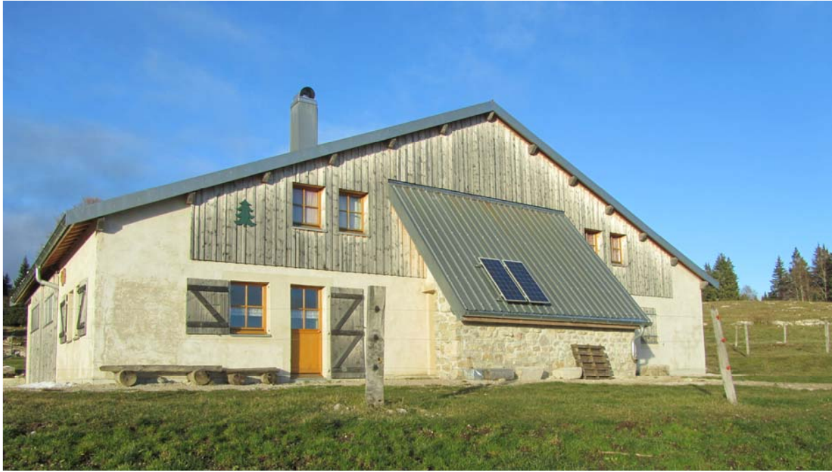
Le très beau territoire quant à lui n'a pas changé.